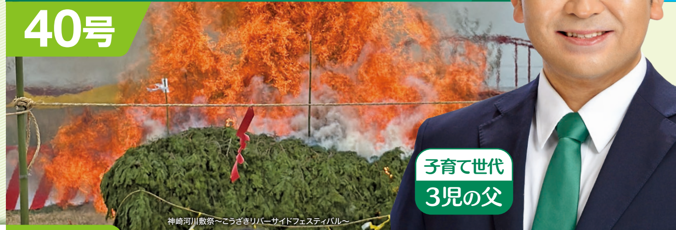
神崎河川敷祭〜こうざきりバーサイドフェスティバル〜